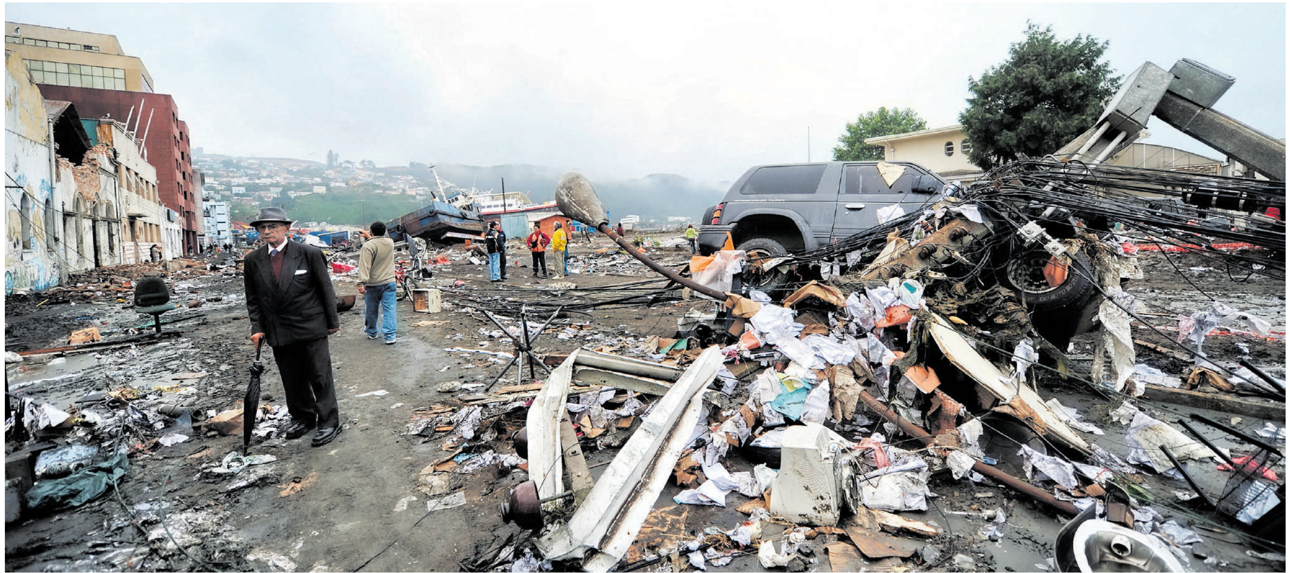
De aardbeving en de daaropvolgende tsunami hebben de Chileense havenstad Talcahuano verwoest. Volgens de burgemeester is 80 procent van de inwoners dakloos geworden.