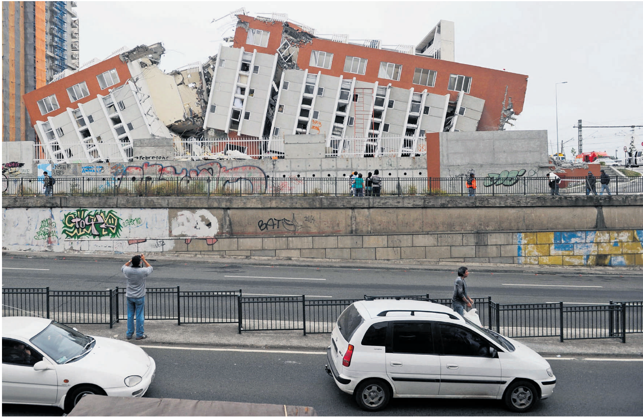
Passanten keken gisteren in de Chileense stad Concepción naar de resten van een gebouw dat zaterdag werd verwoest door een aardbeving van 8,8 op de Schaal van Richter.

logen voorspellen in hun studie een aardschok met een aardverschuiving van tien meter, een afstand die in de buurt komt van de verplaatsing van 7,5 meter die volgens de Amerikaanse geologische dienst werkelijk plaats had bij de beving van zaterdagmorgen.